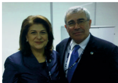
С Министром охраны окружающей среды Румынии Рованой Плумб