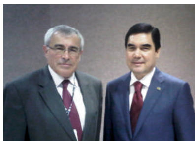
Исполнительный секретарь ЕЭК ООН Свен Алкалай и Президент Туркменистана Гурбангулы Бердымухамедов

РИО+20 Конференция Организации Объединенных Наций по устойчивому развитию