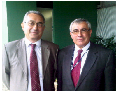
С Директором Федерального Бюро по окружающей среде Швейцарии Бруно Оберле