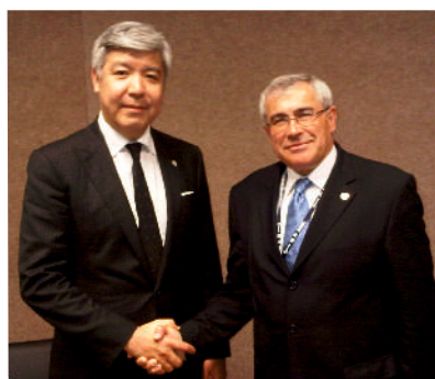
С Министром охраны окружающей среды Казахстана Нурланом Каппаровым