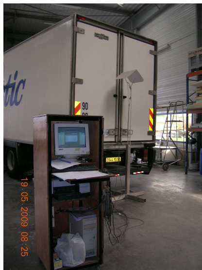
Engin en test d'efficacité dans un centre d'essai

5. L'autorité compétente en France, en lien avec Transfrigoroute France et la station d'essai officielle ATP, le Cemafrroid, a étudié de nouveaux protocoles de test pour les plus de 10 000 tests annuels. Le but était d'élaborer un test robuste simple et économique.