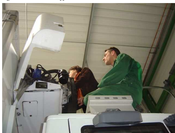
Vérification des équipements par des experts