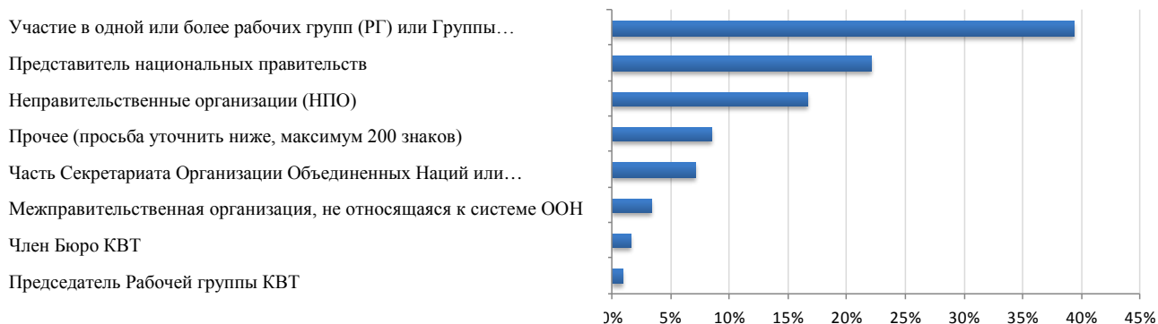
Рис. 4 Ответы в разбивке

44. Ответы свидетельствуют о поддержке деятельности КВТ, обращают внимание на сильные стороны и указывают на те области, в которых необходимо вести более активную работу. Более 70% респондентов сообщили, что КВТ «очень важен» в качестве международного форума для разработки правовых инструментов в области внутреннего транспорта. Около 90% респондентов решительно согласились или в целом согласились, что транспортные конвенции важны для их страны или организации. Являясь центром транспортных конвенций Организации Объединенных Наций, он рассматривается в качестве сравнительного преимущества КВТ, хотя нехватка ресурсов представляет собой сравнительный недостаток. В случае просьбы указать те области, которые нуждаются в большем внимании в будущем, заинтересованные стороны указали правила в области транспортных средств, безопасность дорожного движения и интермодальный транспорт. В то же время ни один из текущих видов деятельности не был сочтен ненужным – напротив, в целом было выражено пожелание укрепить их все.