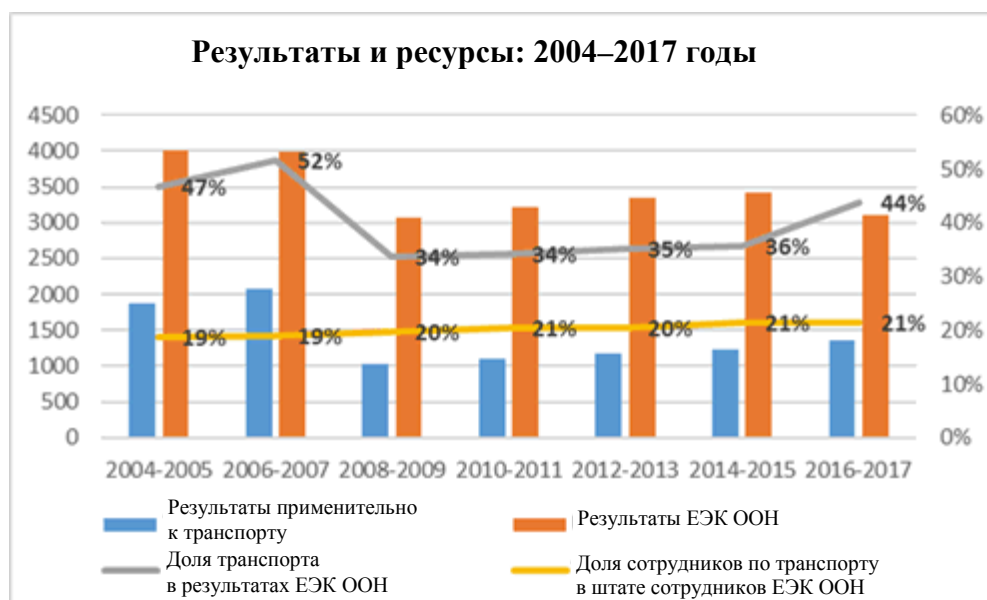
Рис. 3 Результаты и ресурсы: 2004–2017 годы

41. Нехватка ресурсов не дает возможности взять на себя новые задачи, если они не финансируются за счет внебюджетных ресурсов или если не завершены текущие задания.