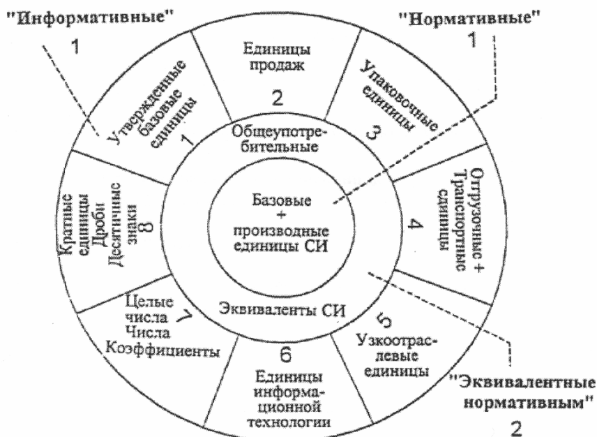
Диаграмма 1. Схема единиц измерения