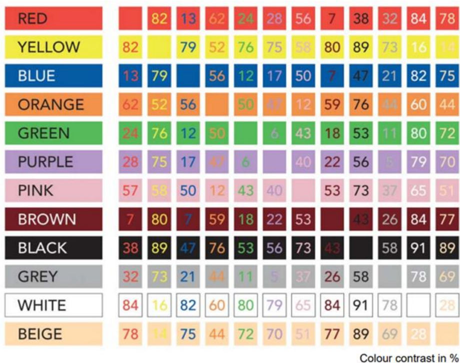
Рис. 1 Влияние цветовых контрастов на удобочитаемость