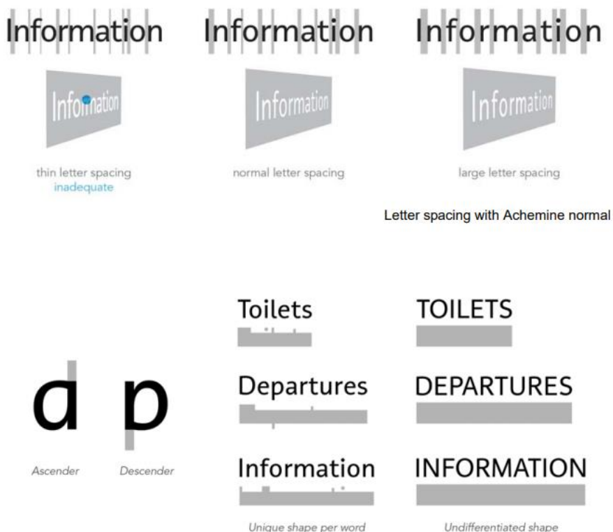
Рис. 2 Влияние типографики на удобочитаемость